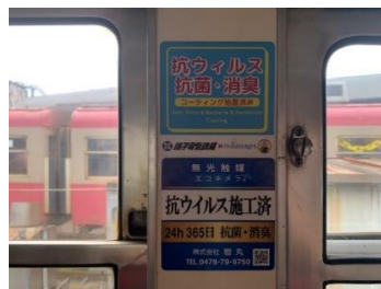
抗ウイルス・抗菌・消臭済ステッカー