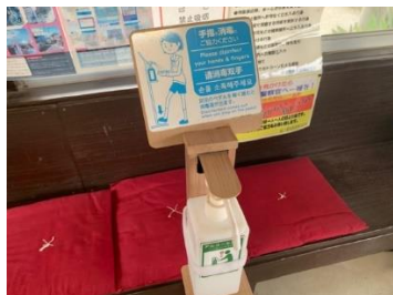
有人駅に設置の消毒液